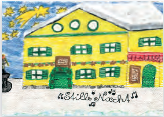
Stille Nacht Haus