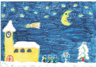
Stille Nacht Kirche