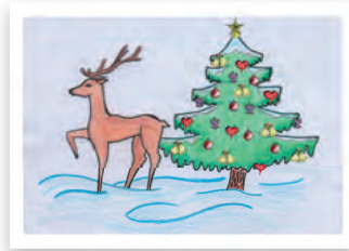
Reh im Wald